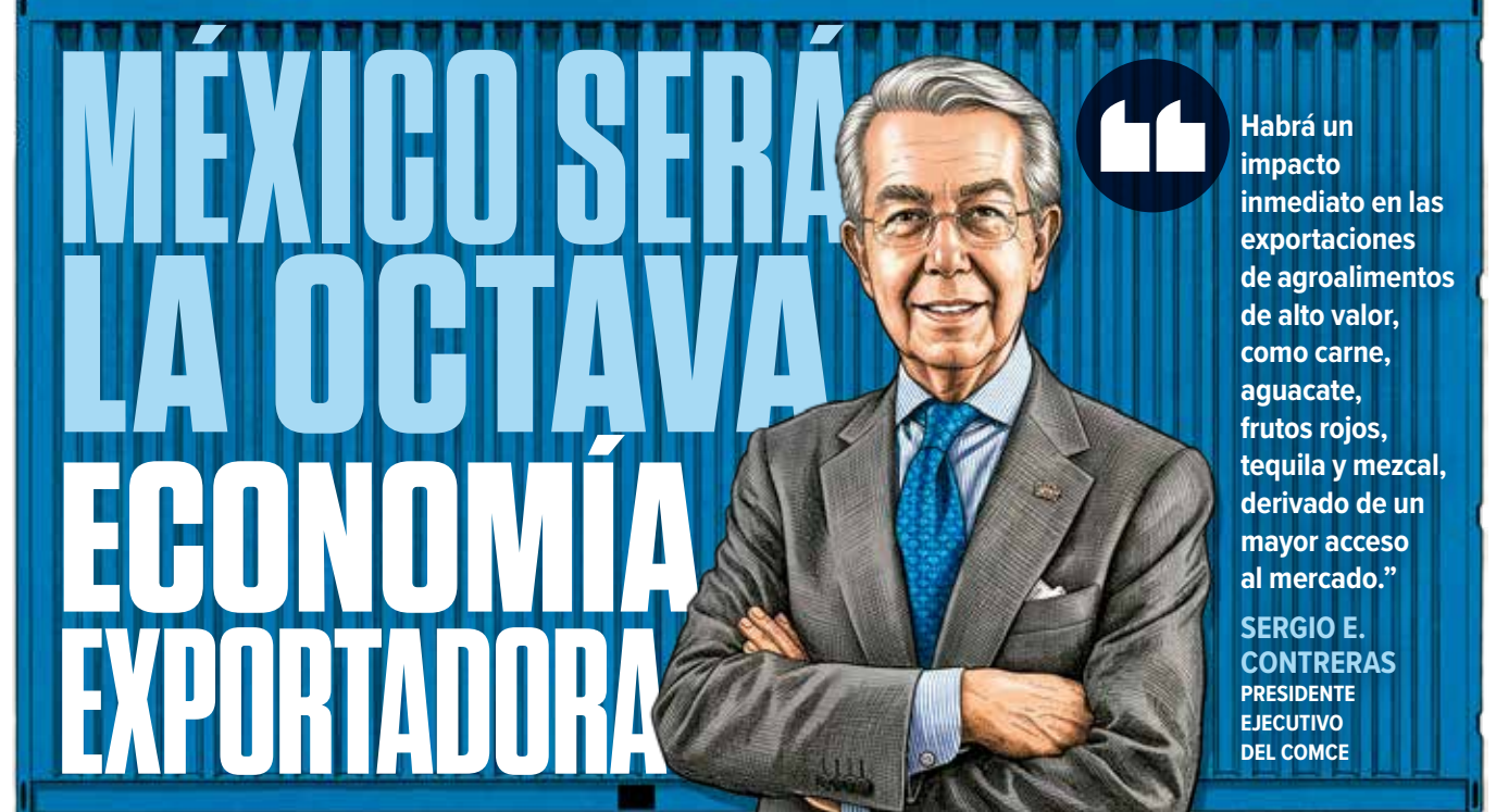
Ilustración: Jesús Sánchez.